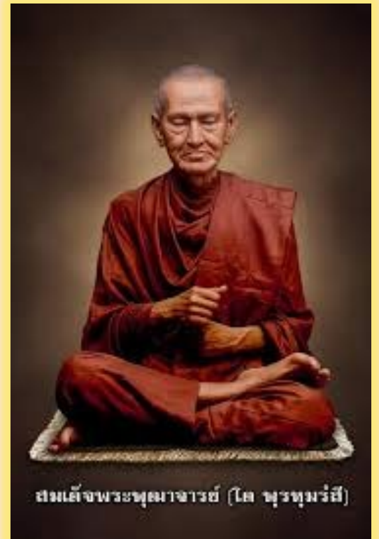
สมเด็จพระพุทธอาจารย์ (โต พรหมรังสี)